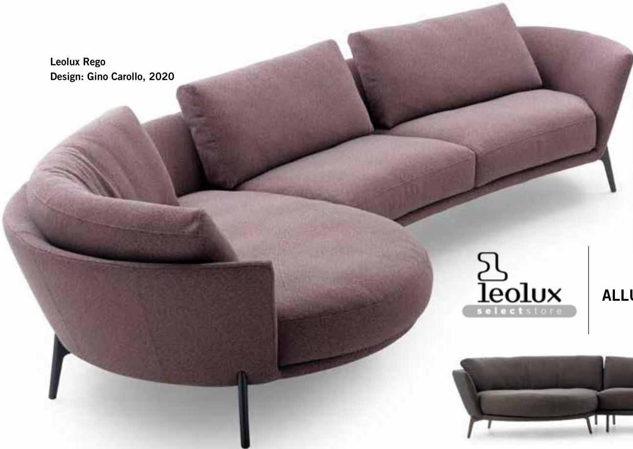
Leolux Rego Design: Gino Carollo, 2020